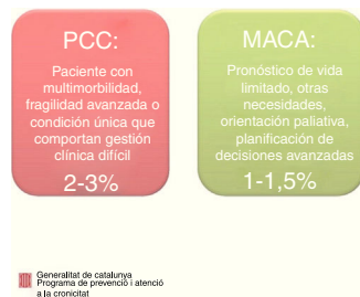
Figura 2 Características del paciente PCC y del paciente MACA.

La atención psicológica, social y espiritual de los pacientes con enfermedades avanzadas que se enfrentan al final de la vida es esencial. El Programa de Atención Integral a Enfermos Avanzados (y los EAPS que lo conforman), con estudios con una N superior a 20.000 pacientes, han mostrado clara evidencia respecto a la eficacia de las intervenciones psicológicas en la atención a personas con enfermedades avanzadas. Se han encontrado mejoras significativas en parámetros como ansiedad, malestar emocional, sentido de la vida, sentimientos de paz y perdón, en el bienestar general, el insomnio y la ansiedad (Gómez-Batiste et al., 2011a; Mateo Ortega et al., 2013).